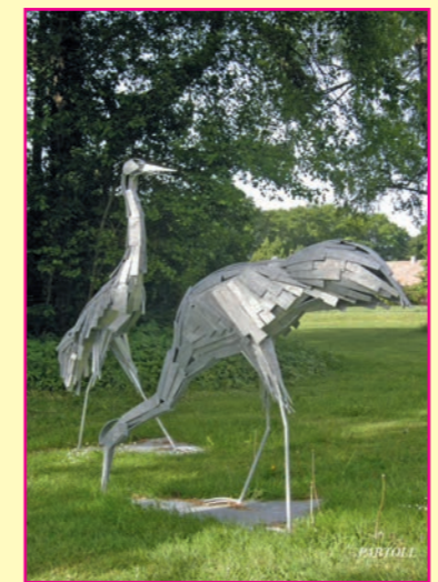
Kraniche von Edwin Partoll, Ausstellung in der St. Nicolai-Kirche