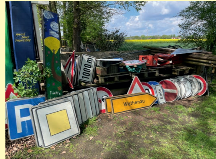
Ausrangierte Verkehrsschilder werden von den teilnehmenden Kunstschaffenden gestaltet.

Wer denkt bei Verkehrsschildern nicht sofort an den „sagenumwobenen“ Schilderwald, Überregulation und Einschränkung der individuellen Bewegungsfreiheit? Erstmals in der Geschichte von „Kunst in der City“ haben die teilnehmenden Künstlerinnen und Künstler ein gemeinsames Kunstwerk geschaffen. Als Gestaltungsgrundlage dienten 42 ausrangierte Verkehrszeichen, die individuell gestaltet wurden. Wie Blätter an den Ästen, hängen die Zeitzeichen in zwei Bäumen im Diepholzer Amtsgarten